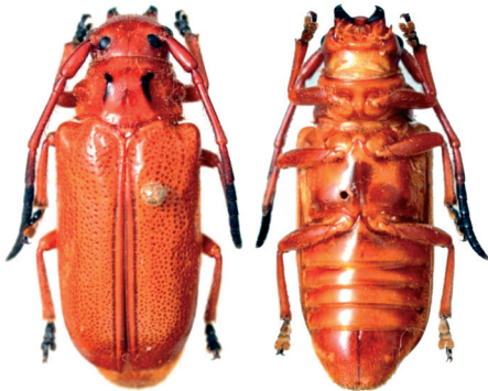
Figure 1. – Eustathes celebensis n. sp., holotype.

Corps entièrement rouge orangé, recouvert d'une pubescence éparsée dorée.